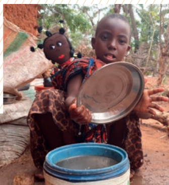
> Een vaatwasmachine? Nee, afwassen met de hand!