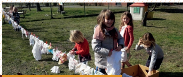
> Ook de was en de plas moet gebeuren ...